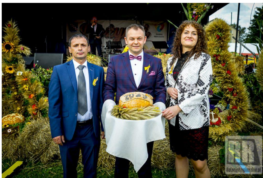
Zdjęcie nr 11 Organizacja Dożynek Gminnych w Sędzistawiu

Należy zwrócić uwagę na działania podejmowane przez Koła Gospodyń Wiejskich: „OdNowa” z Pastewnika, KGW „Pustelniki” z Pustelnika i KGW „Dobrem Tkane” z Marciszowa, które zorganizowały wiele atrakcji i imprez skierowanych do Mieszkańców Gminy oraz aktywnie promują Gminę na zewnątrz, m.in. poprzez uczestnictwo w ponadlokalnych wydarzeniach.