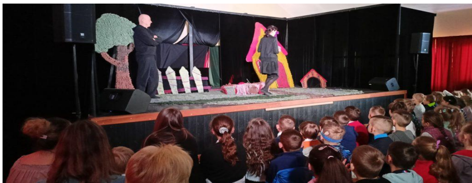
Zdjęcie nr 13 Teatr Zdrojowy Animacji z Jeleniej Góry