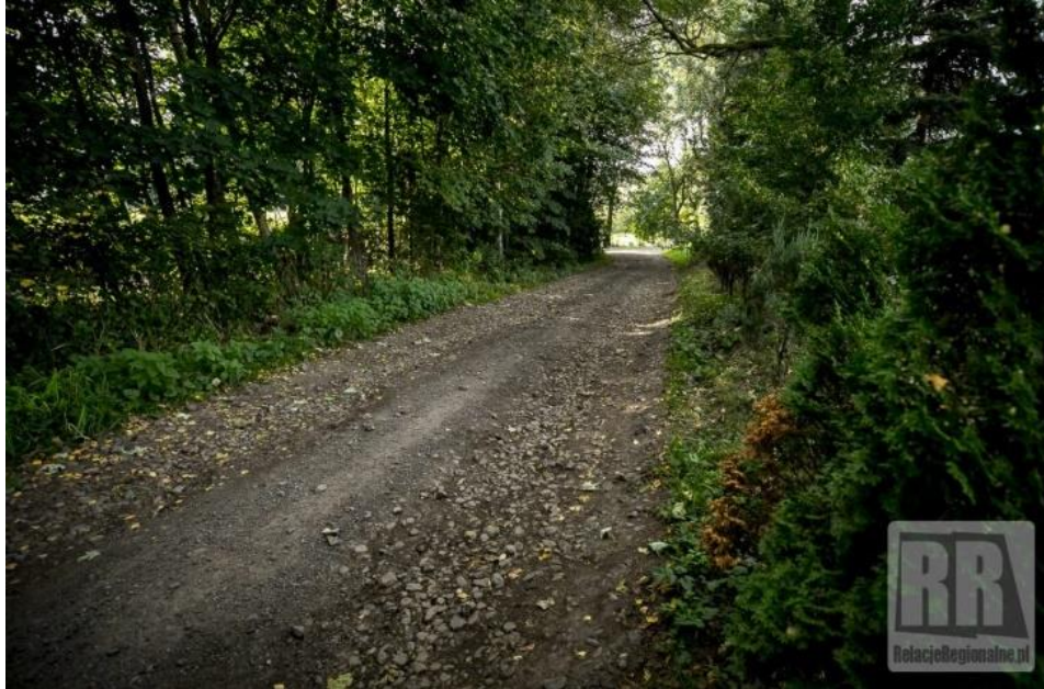
Zdjęcie nr 3 Droga do gruntów rolnych w Ciechanowicach przed...