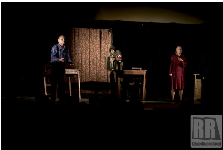
Zdjęcie nr 14 Wrocławski Teatr Formy