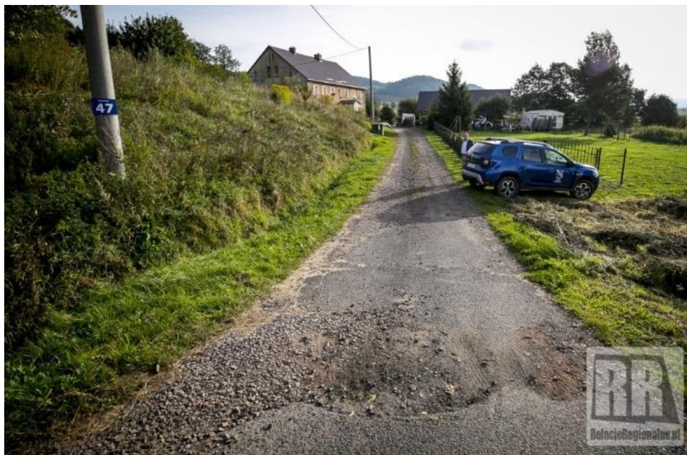
Zdjęcie nr 5 Przebudowa i modernizacja drogi gminnej w Świdniku przed ...