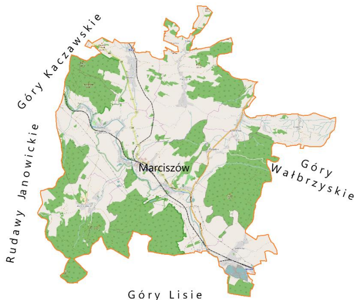
Mapa nr 1 Położenie geograficzne Gminy

Część obszaru Gminy jest zlokalizowana w granicach Rudawskiego Parku Krajobrazowego, a tym samym w obszarze chronionym otuliny Natura 2000. Położenie Marciszowa jest niezwykle dogodne ze względu na wysokie walory turystyczne oraz warunki sprzyjające osiedlaniu się ludzi ceniących sobie spokój i bliskość natury. Na terenie Gminy Marciszów i przebiegającej rzeki Bóbr - uchodzi rzeka Lesk oraz potok Bobrek. Powierzchnia Gminy wynosi 81,6 km 2 , co stanowi ponad 20,7% powierzchni powiatu kamiennogórskiego. Ze względu na swoje położenie geograficzne Gmina ma charakter rolniczy. Wobec tego blisko 46% jej powierzchni stanowią użytki rolne. Drugą kategorią pod względem wielkości są lasy pokrywające ponad 36% jej powierzchni, co lokuje Gminę Marciszów ponad średnią dla województwa i całego kraju w kategorii zalesienia obszaru.