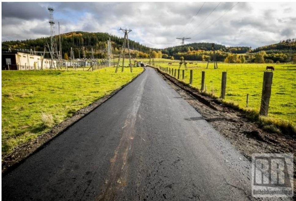
Zdjęcie nr 2 Droga dojazdowa do gruntów rolnych w Marciszowie po...