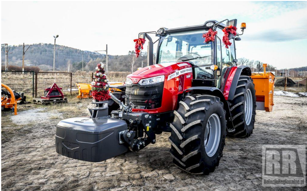
Zdjęcie nr 10 Zakup ciągnika Massey Ferguson 5711M