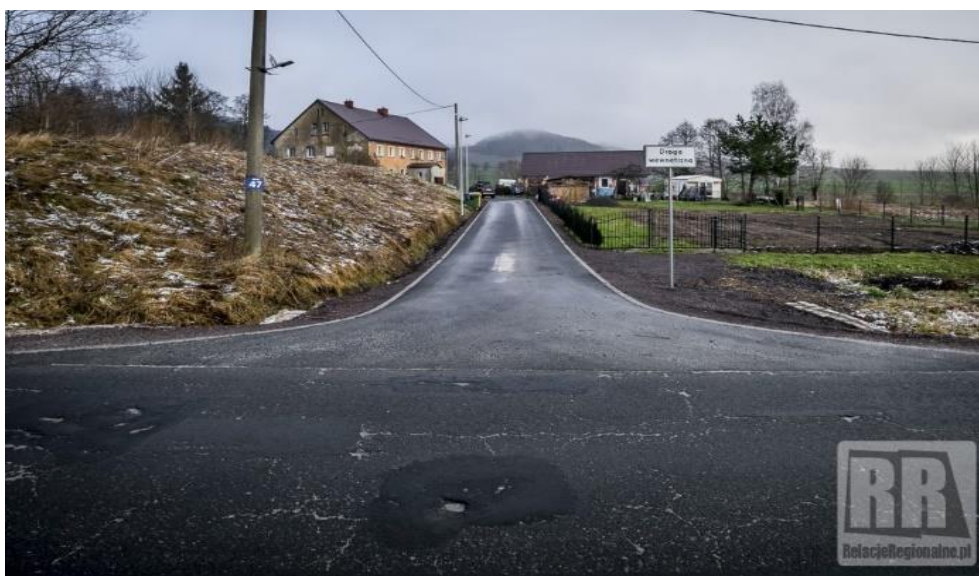
Zdjęcie nr 6 Przebudowa i modernizacja drogi gminnej w Świdniku po