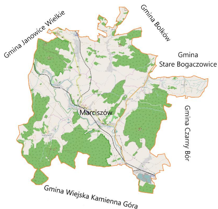
Mapa nr 2 Graniczenie z innymi gminami