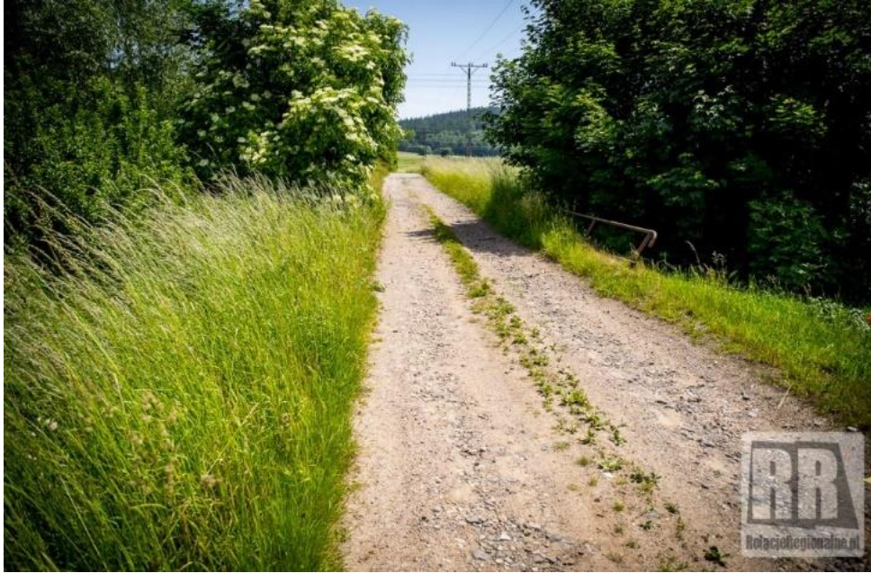
Zdjęcie nr 1 Droga dojazdowa do gruntów rolnych w Marciszowie przed...