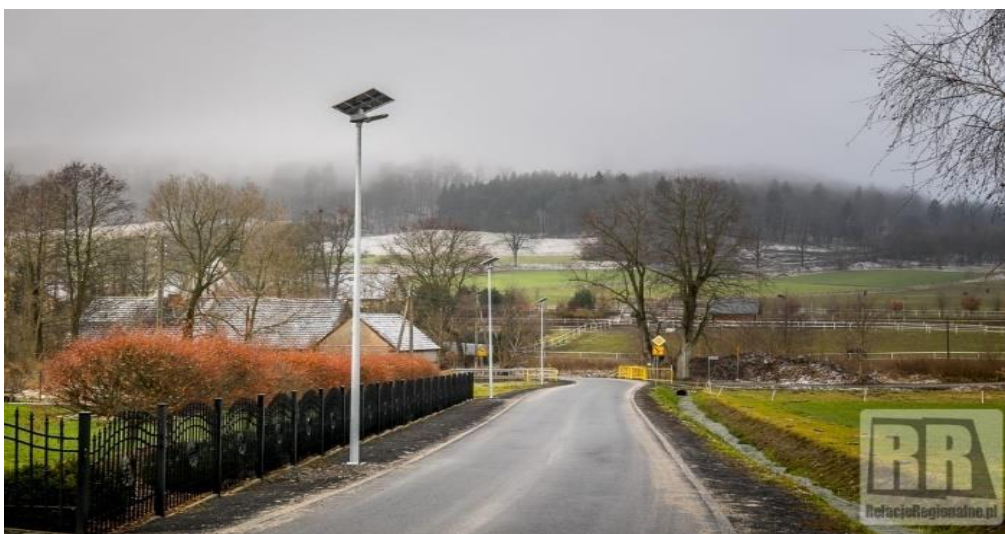
Zdjęcia nr 8, 9 Modernizacja oświetlenia drogowego w Gminie