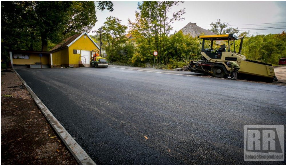
Zdjęcie nr 7 Utwardzenie placu przed świetlicą w Nagórniku