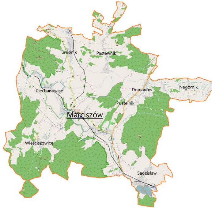
Mapa nr 3 Wykaz sołectw w Gminie