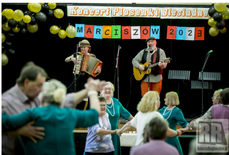
Zdjęcie nr 15 Koncert Piosenki Biesiadnej