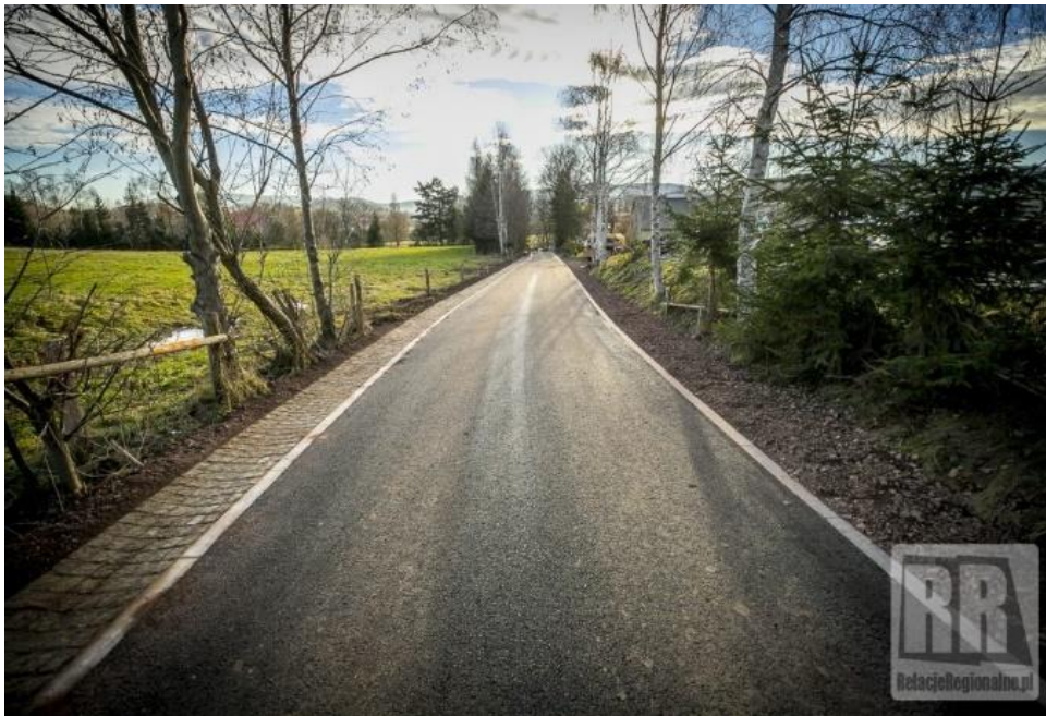
Zdjęcie nr 4 Droga do gruntów rolnych w Ciechanowicach po...